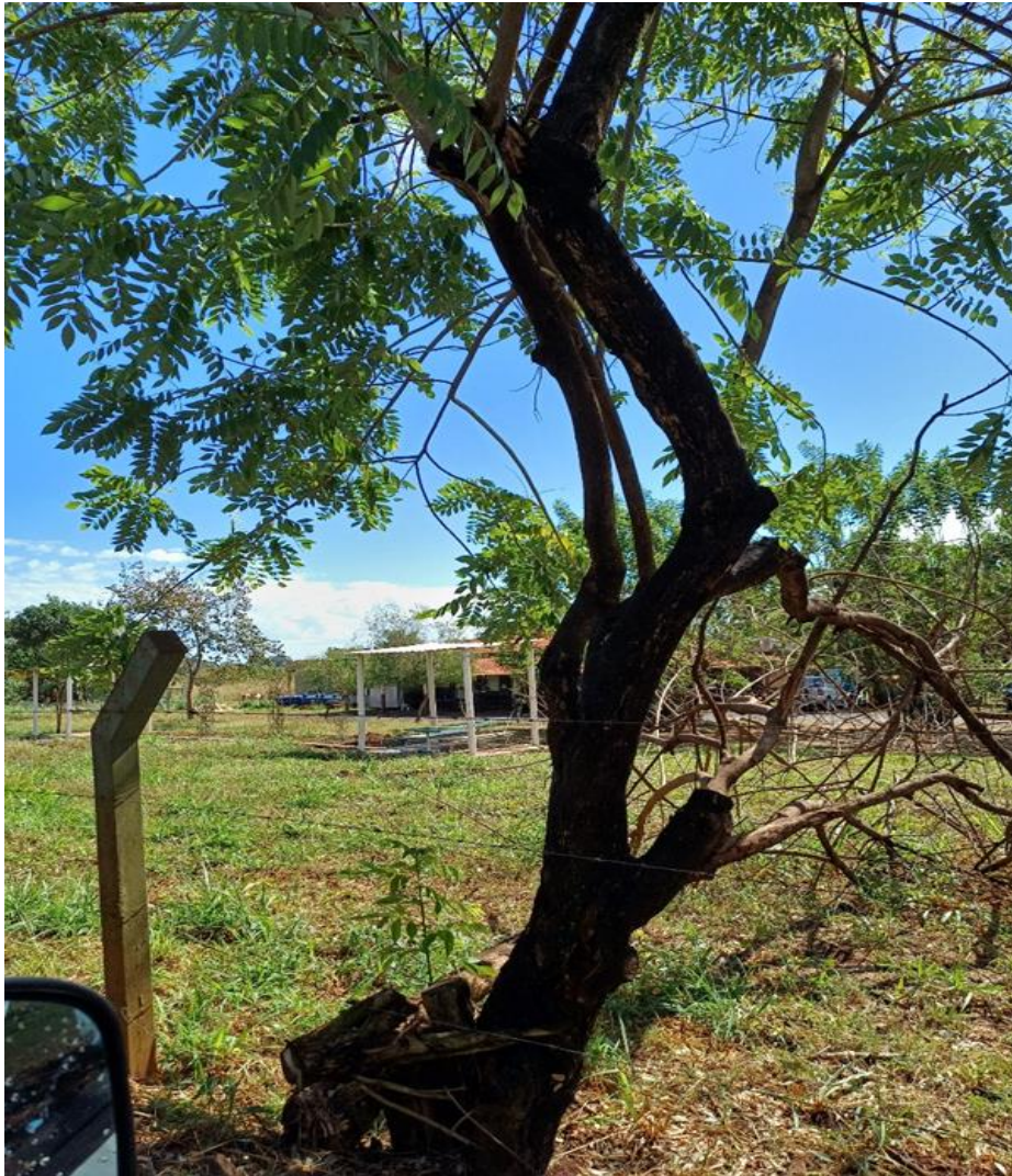
FAZENDA DA BARRA