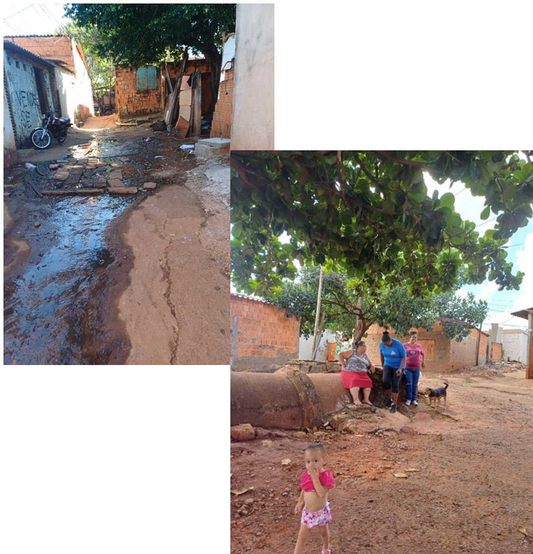
BAR DO ZÉ (COMUNIDADE)