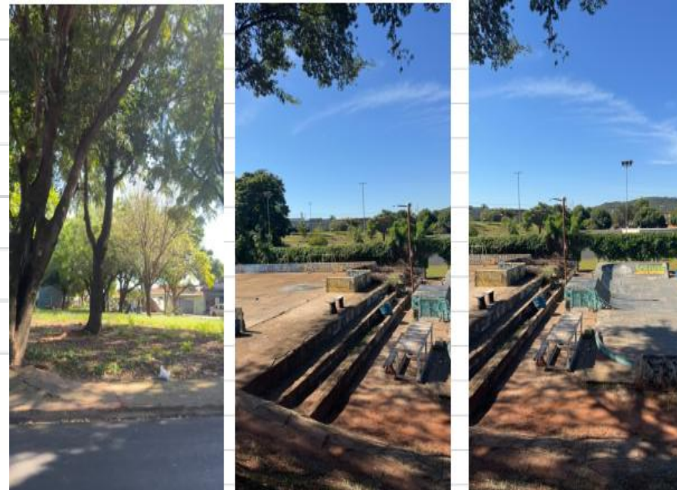
Imagem 1 : pista de skate

S- vejo uma pista de skate que está cercada de mato alto e iluminação precária na parte da noite, deixando várias áreas muito escuras